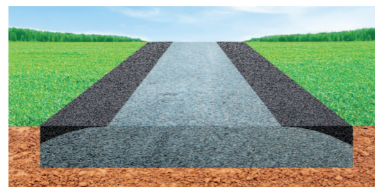
Przywracanie profilu za pomocą równiarki lub wykańczarki.

Prostota stosowania, długotrwała odporność, możliwość przechowywania... Compomac®, gęsta mieszanka do stosowania na zimno, dostępna luzem, w big bagach lub workach, już od wielu lat jest wzorcowym produktem przeznaczonym do wszelkich drobnych napraw nawierzchni, ciągłych i miejscowych.