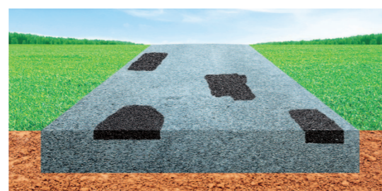
Wypełnianie wybojów i ubytków.